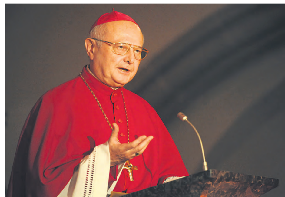
Der Vorsitzende der Deutschen Bischofskonferenz, Erzbischof Dr. Robert Zollitsch, richtete ein Grußwort an den „Kulturhauptstadt-bischof“ und die Gläubigen des Ruhrbistums.