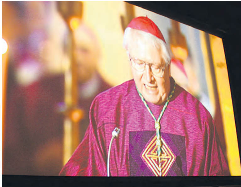
Auf der Leinwand in der Lichtburg: Weihbischof Vorrath.

...Wir freuen uns über Dich als unseren neuen Bischof im Ruhrbistum. Ab heute stehst Du an der Spitze einer Diözese, die am kommenden ersten Januar 52 Jahre alt wird. Als junges Bistum bekommen wir einen jungen Bischof!