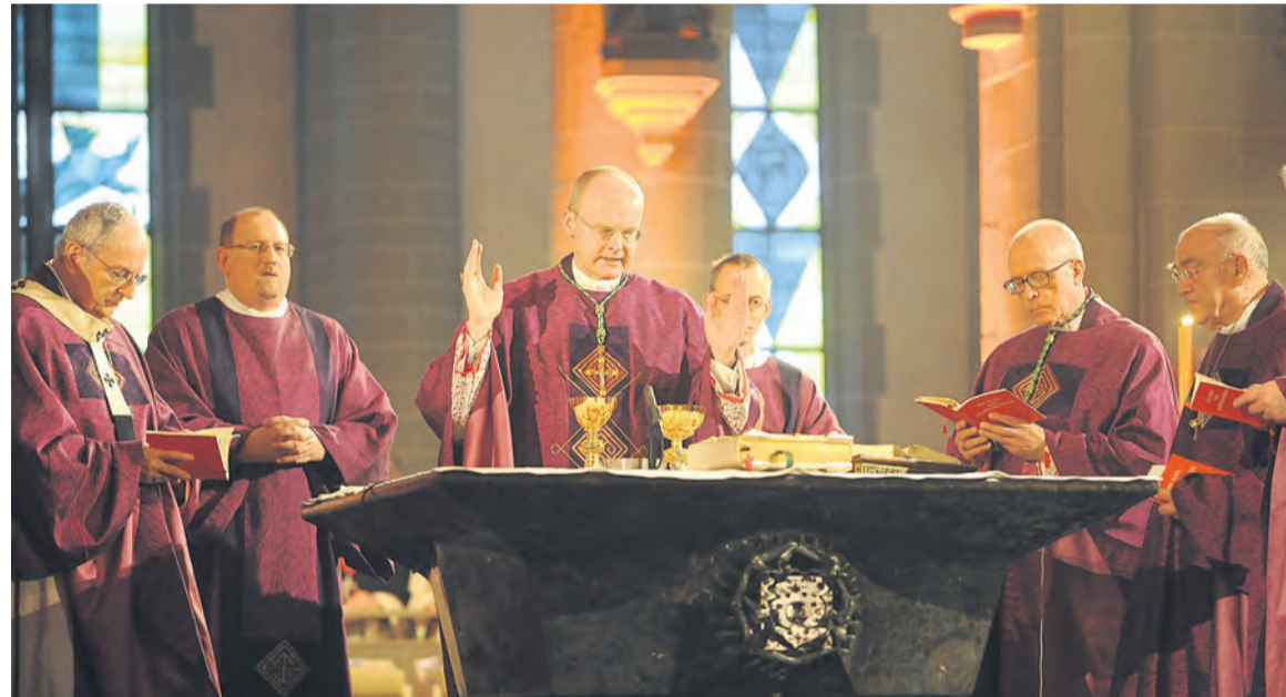
Eucharistisches Hochgebet: Auf dem Bild zu sehen sind Kardinal Meisner, Diakon Klöckner, Bischof Overbeck, Nuntius Pèrisset und Altbischof Luthe (v. l.).