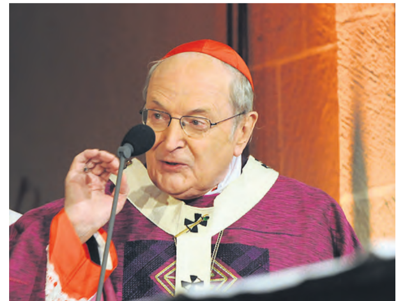
Worte von Kardinal Joachim Meisner im Dom.

Als Metropolit der Kölner Kirchenprovinz begehe ich heute zum 8. Mal die Einführung eines Bischofs in seine ihm vom Heiligen Vater übertragene Diözese. Vielleicht ist jemand dann geneigt, zu denken: „Das ist bei dem sicher schon Routine!“. Das wäre weit gefehlt! Die Einführung eines Bischofs ist etwas anderes als die Übernahme einer Bank oder eines Konzerns durch einen neuen Direktor. Hier handelt es sich um einen zutiefst geistlichen Vorgang. Wer Gemeinschaft mit Gott, dem Vater, haben will, kann dazu nur über den Weg des Sohnes gelangen. Zum Sohn aber gelangt man nur über jene, die vor uns auf dem Weg gewandelt sind und damit selbst lebendiger Teil dieses Weges geworden sind. Dies sind zuerst die Apostel als direkte Augenzeugen des Wortes. Sie haben sich nicht verhört: „Augenzeuge“ des Wortes,