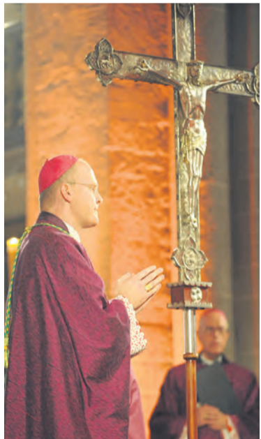
Impression vom Pontifikalamt – Moment der Andacht.

der Ursprünglichkeit, des Prinzips, das nicht nur rein zeitlich am Anfang steht, sondern allem, was mit ihm in lebendiger Gemeinschaft verharret, den Stempel der Echtheit aufdrückt. Im treuen Festhalten an der lebendigen Gemeinschaft mit dem, was von Anfang an war, tritt der Bischof, der natürlich an Raum und Zeit gebunden ist, in die Wirklichkeit dessen ein, der frei von diesen Begrenzungen gestern, heute und in Ewigkeit derselbe ist, also in die Wirklichkeit des Sohnes, der im absoluten Sinn selbst im Anfang ist. Über Raum und Zeit hinweg schafft diese Gemeinschaft, die wir „Apostolische Sukzession“ nennen, Identität und Kontinuität mitten in einer Welt, die dem steten Wandel unterworfen ist. Darum ist ein Bischof nicht in erster Linie der Chef einer Diözese, sondern er ist das sakramentale Zeichen, dass die Diözese Essen in lebendiger Kontinuität mit dem apostolischen Anfang verbunden ist und damit mit Christus, der – wie wir gerade hörten – derselbe ist, gestern, heute und in Ewigkeit ist.